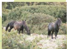
Giarra di Gesturi