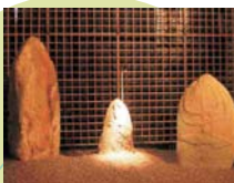
Laconi, Museo dei menhirs