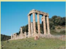
Tempio di Antas