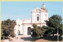
Cagliari - N.S. di Bonaria, il bastione di Saint Remy e la Spiaggia del Poetto

Schreibt uns! Ihr erhaltet umgehend alle Informationen, die Ihr für Eure Touren braucht: empfohlene Strecken, Kilometerangaben, Zeitpläne, Weinkunde, Kunsthandwerk, Veranstaltungen und Feste, Unterkünfte, Tarife touristischer Dienste, Eintrittspreise für Sehenswürdigkeiten.