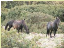
Giara di Gesturi